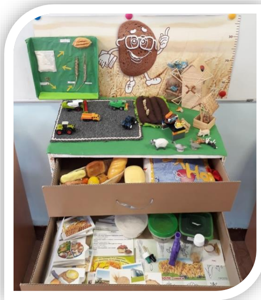
Макет «От колоска до каравая»