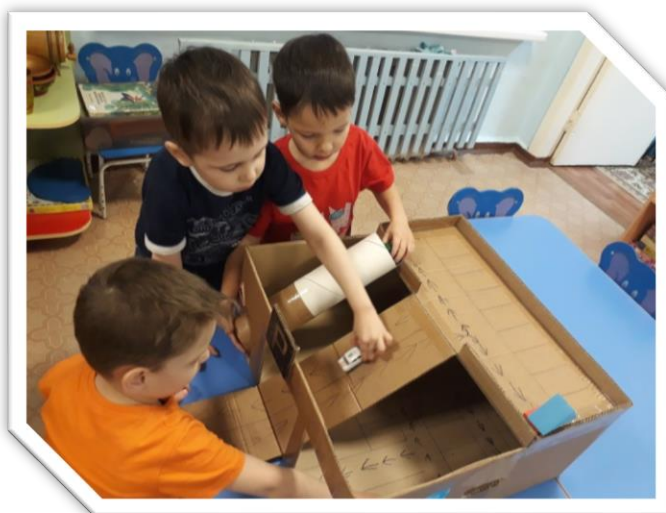
Дидактическая игра «Лабиринт»