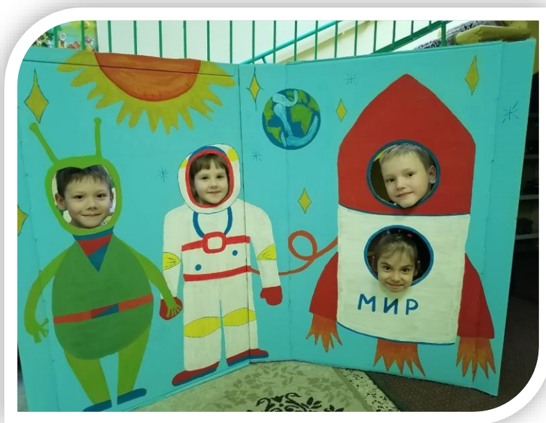
Фотозона «Космические просторы»