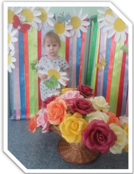
Оформление фотозон к 23 февраля и 8 марта