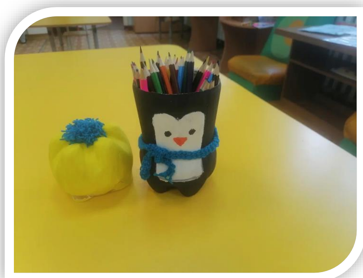
Вторая жизнь пластиковых вещей